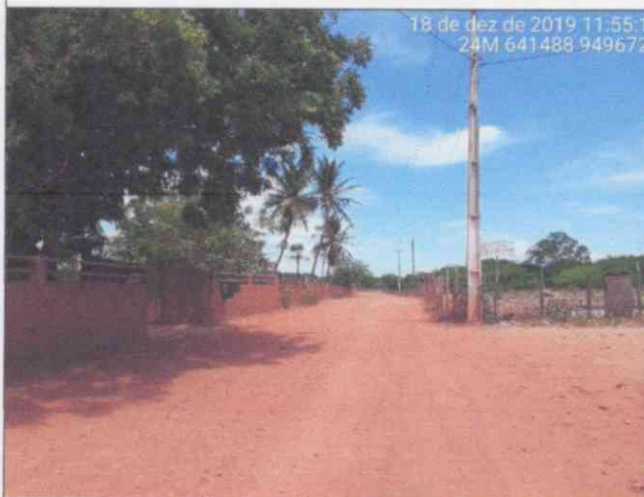
Visão Geral da via – Estaca 0+410,00