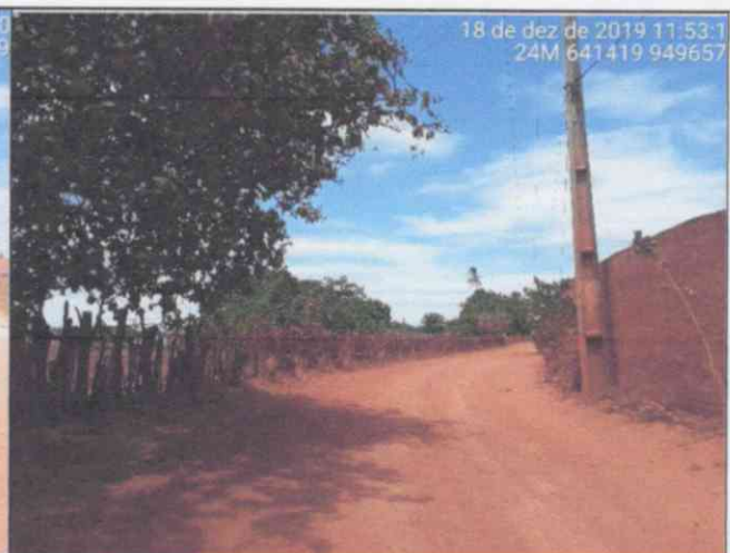
Visão Geral da via – Estaca 0+240,00