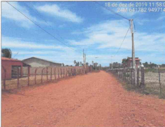
Visão Geral da via – Estaca 0+940,00