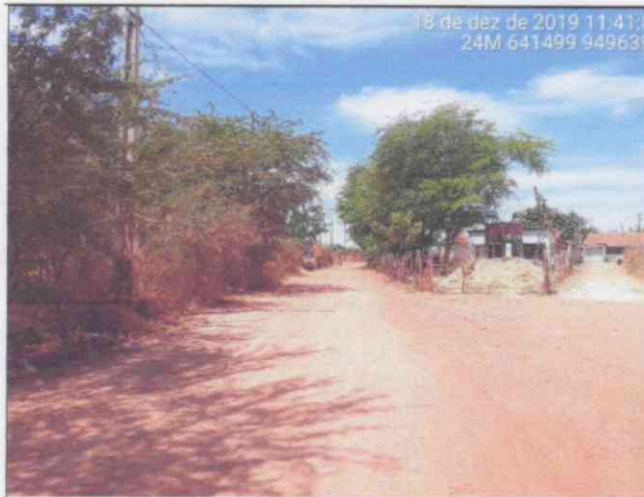
Visão Geral da via – Estaca 0+040,00