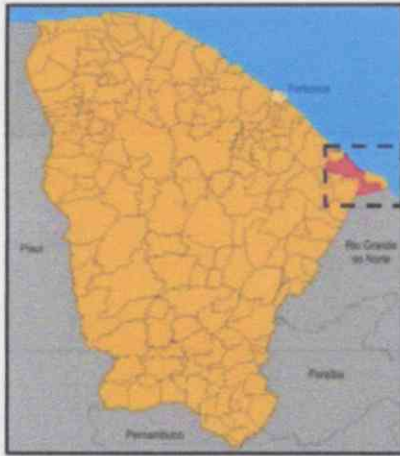
Localização do Município

O Município está localizada conforme mapas abaixo: