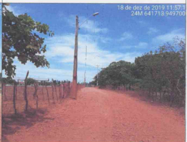
Visão Geral da via – Estaca 0+800,00