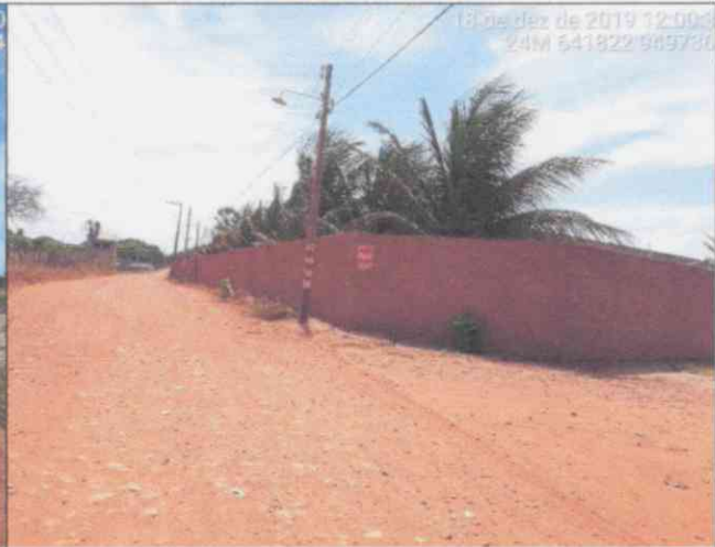
Visão Geral da via – Estaca 1+170,00