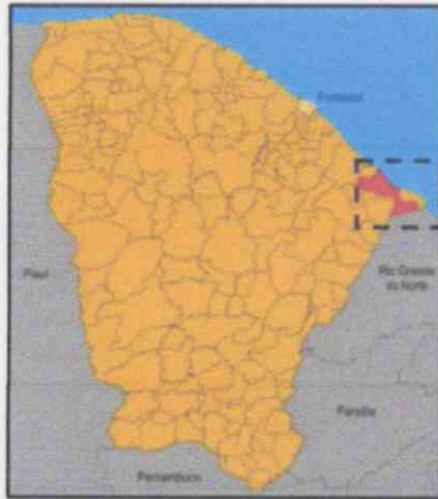
Localização do Município