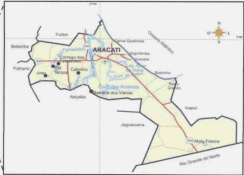
Situação do Município