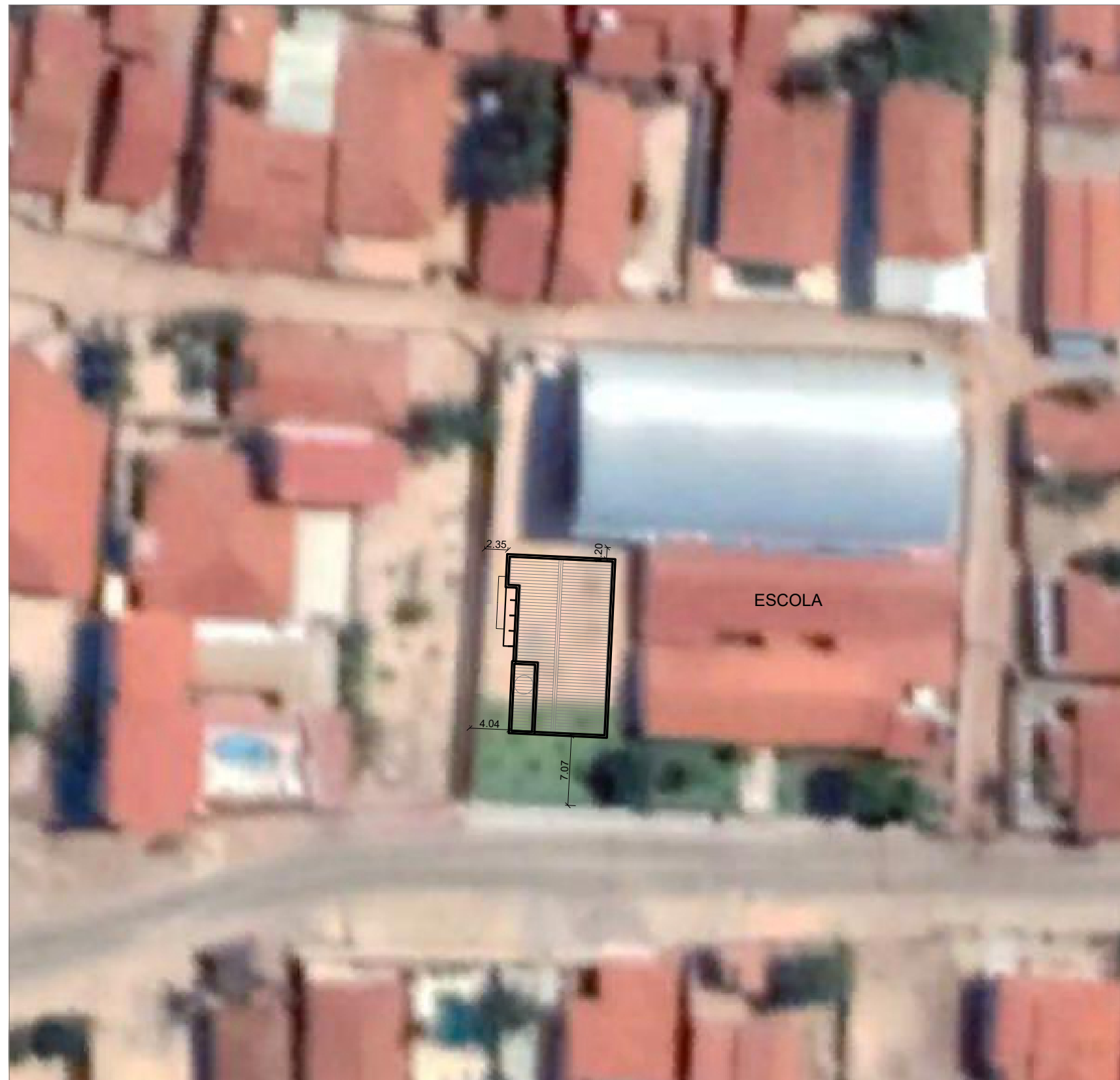
01 PLANTA DE IMPLANTAÇÃO ESCALA 1/500