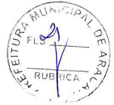
ZÓZIMO LUÍS DE MEDEIROS SILVA Secretário Municipal da Saúde