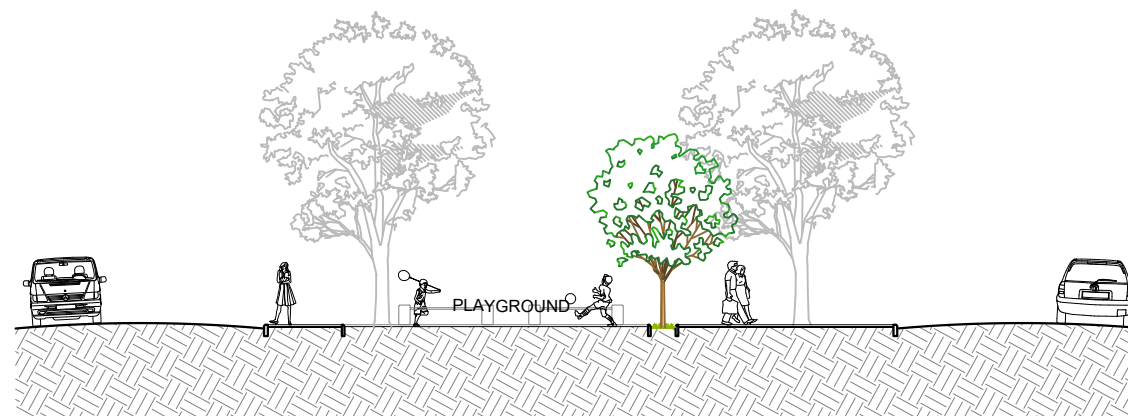
02 CORTE BB ESCALA 1/200