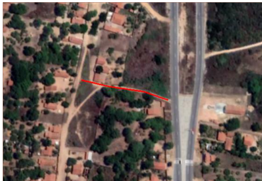
PLANTA DE SITUAÇÃO SEM ESCALA