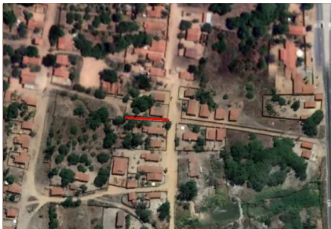
PLANTA DE SITUAÇÃO SEM ESCALA