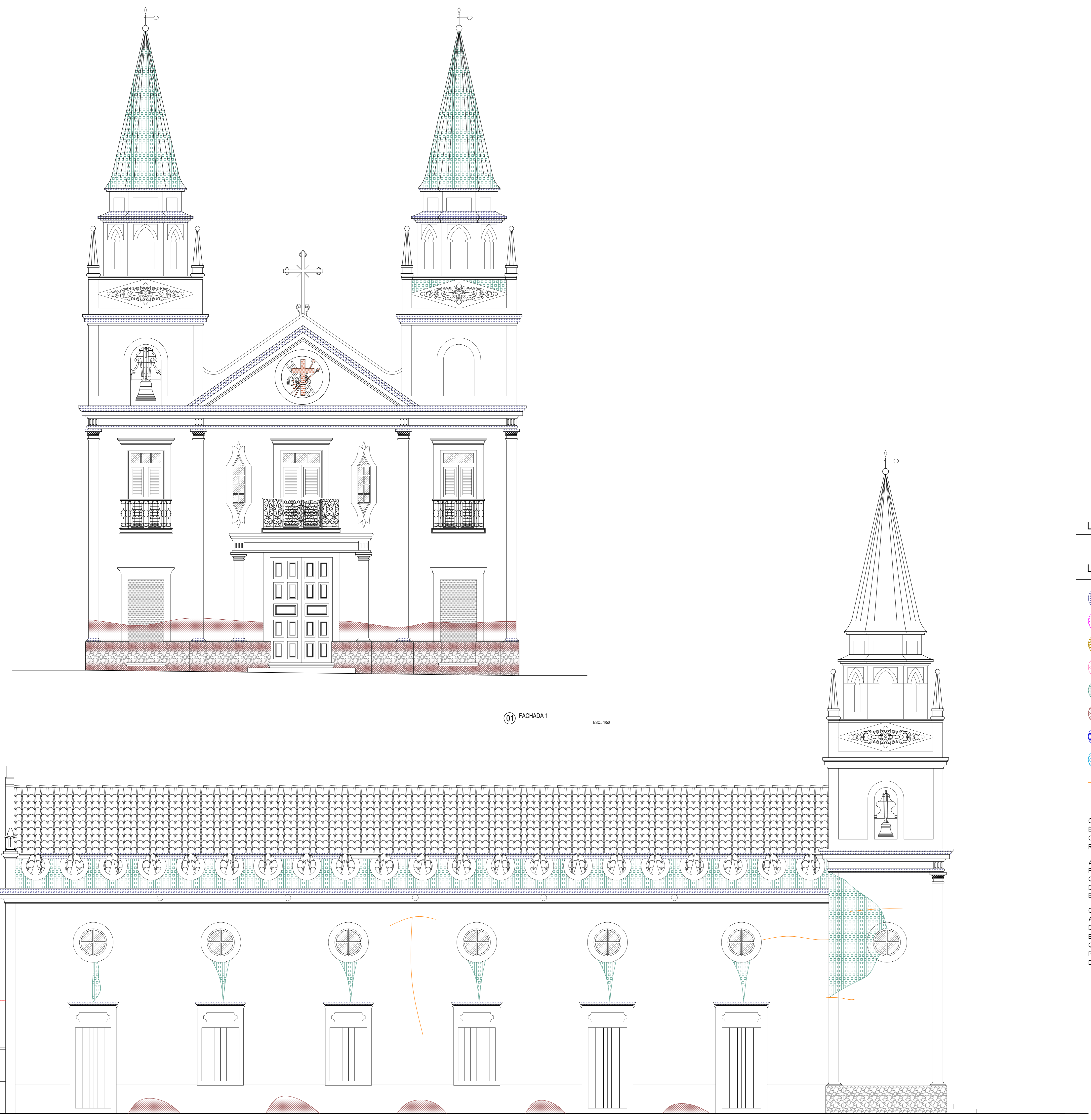
01 FACHADA 1 ESC: 1/50