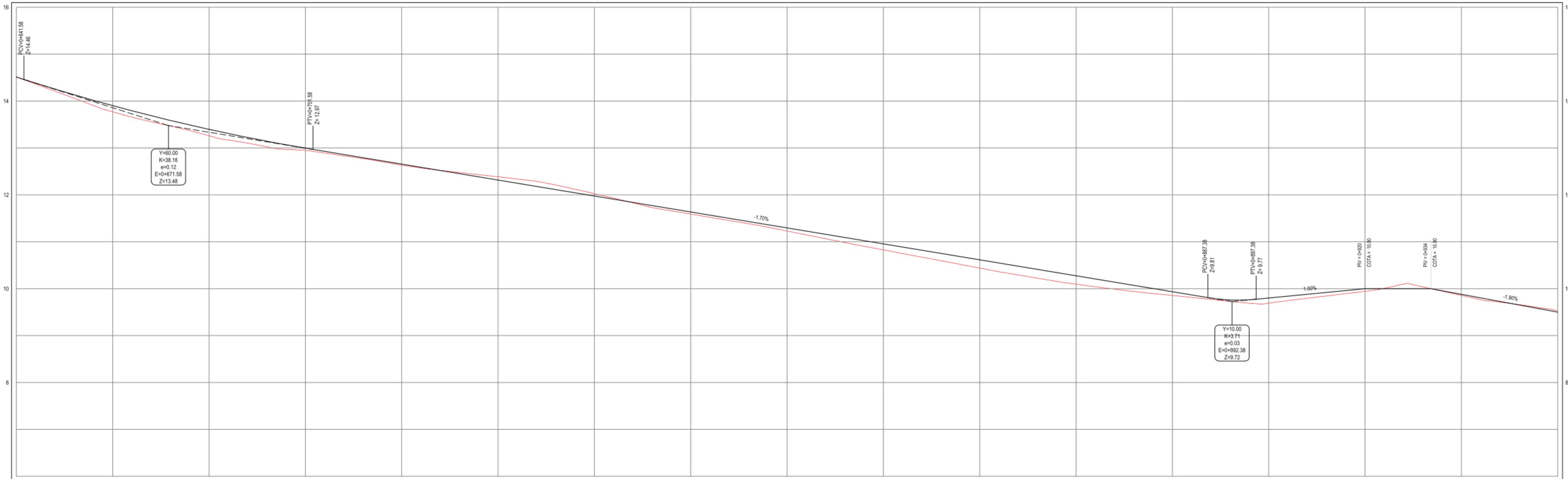
PERFIL: ACESSO VOLTA - T1