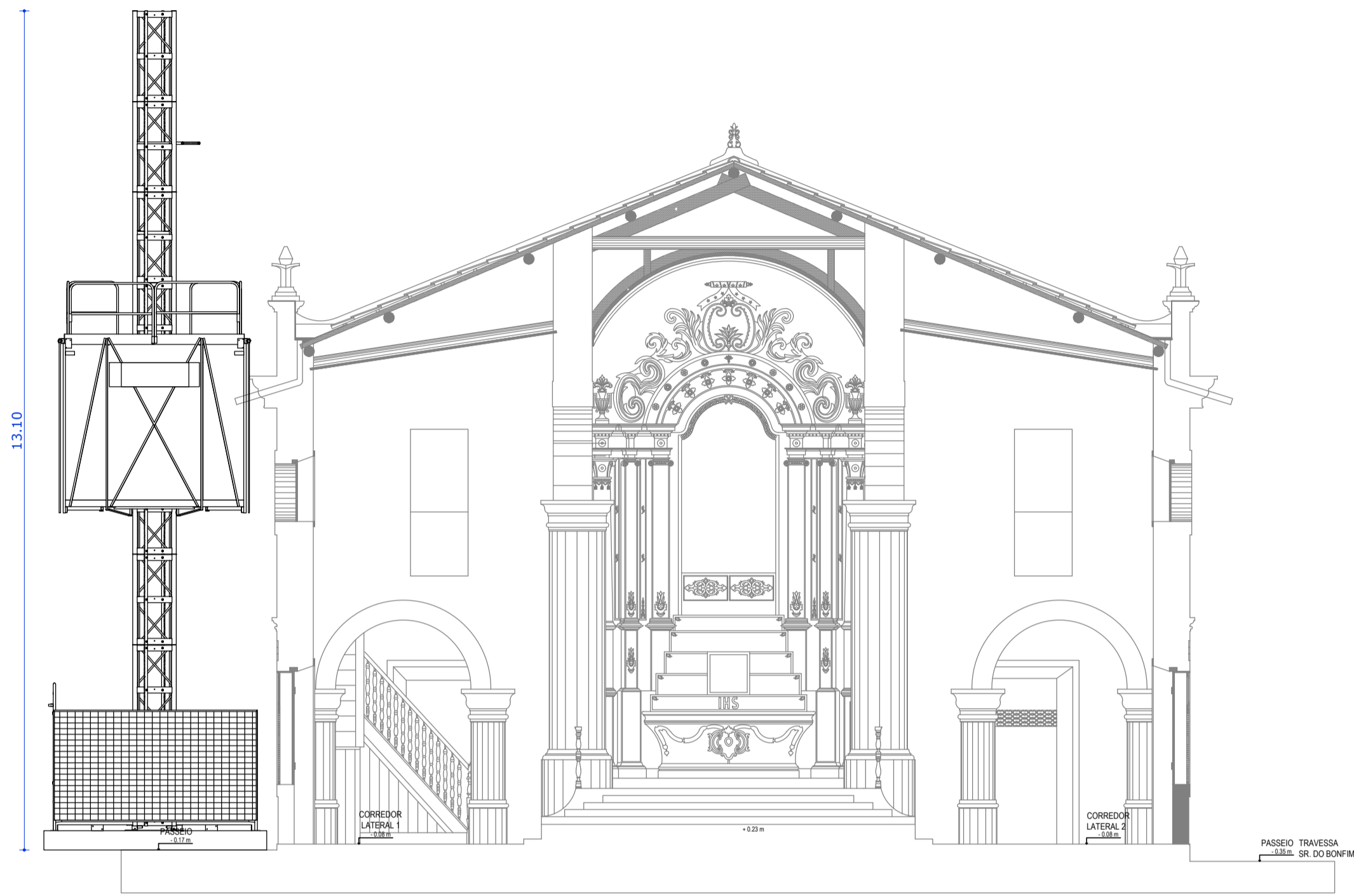
01 CORTE B - ELEVADOR CREMALHEIRA ESC: 1/75