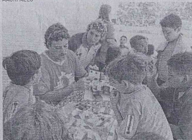
A ONG Cumbuco Bom de Bola e o Instituto Solidário desenvolvem atividades com crianças do Cumbuco

LAIS OLIVEIRA ESPECIAL PARA O POVO cotidiano@opovo.com.br