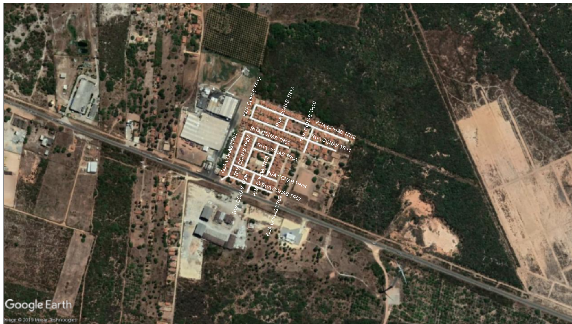
PLANTA DE LOCALIZAÇÃO ESCALA: 1:7500