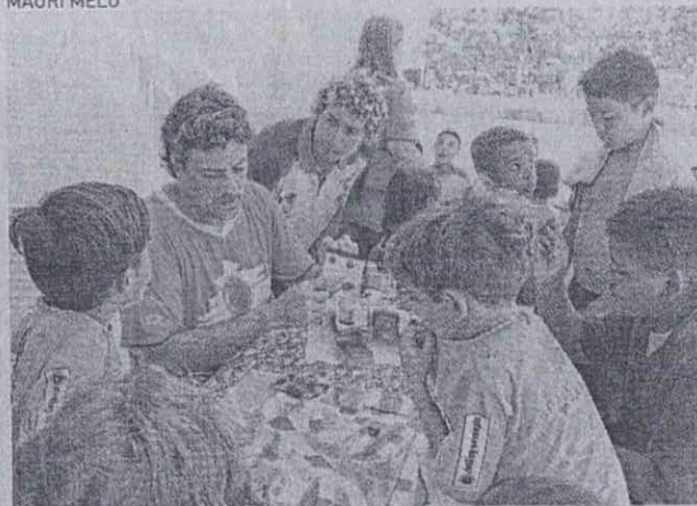
A ONG Cumbuco Bom de Bola e o Instituto Solidário desenvolvem atividades com crianças do Cumbuco

LAIS OLIVEIRA ESPECIAL PARA O POVO cotidiano@opovo.com.br