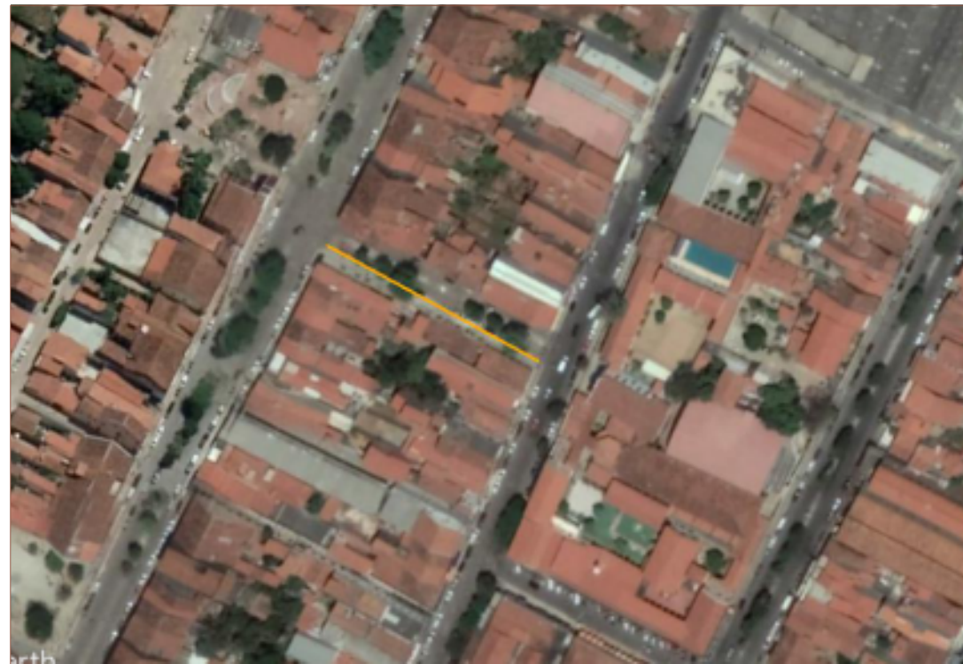
PLANTA DE SITUAÇÃO SEM ESCALA