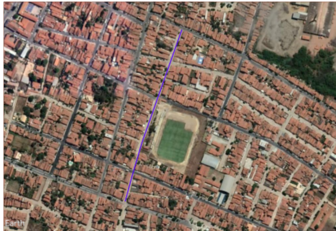
PLANTA DE SITUAÇÃO SEM ESCALA