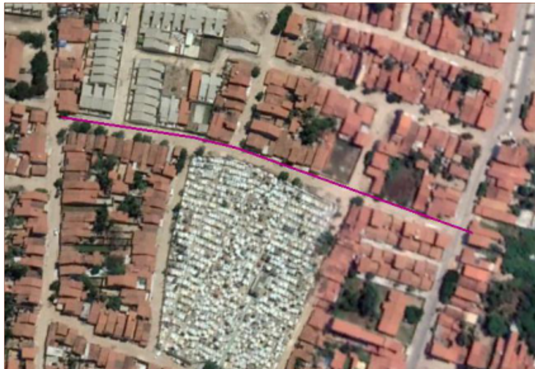
PLANTA DE SITUAÇÃO SEM ESCALA