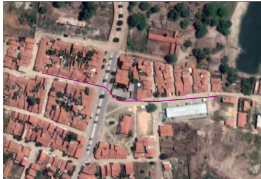
PLANTA DE SITUAÇÃO SEM ESCALA