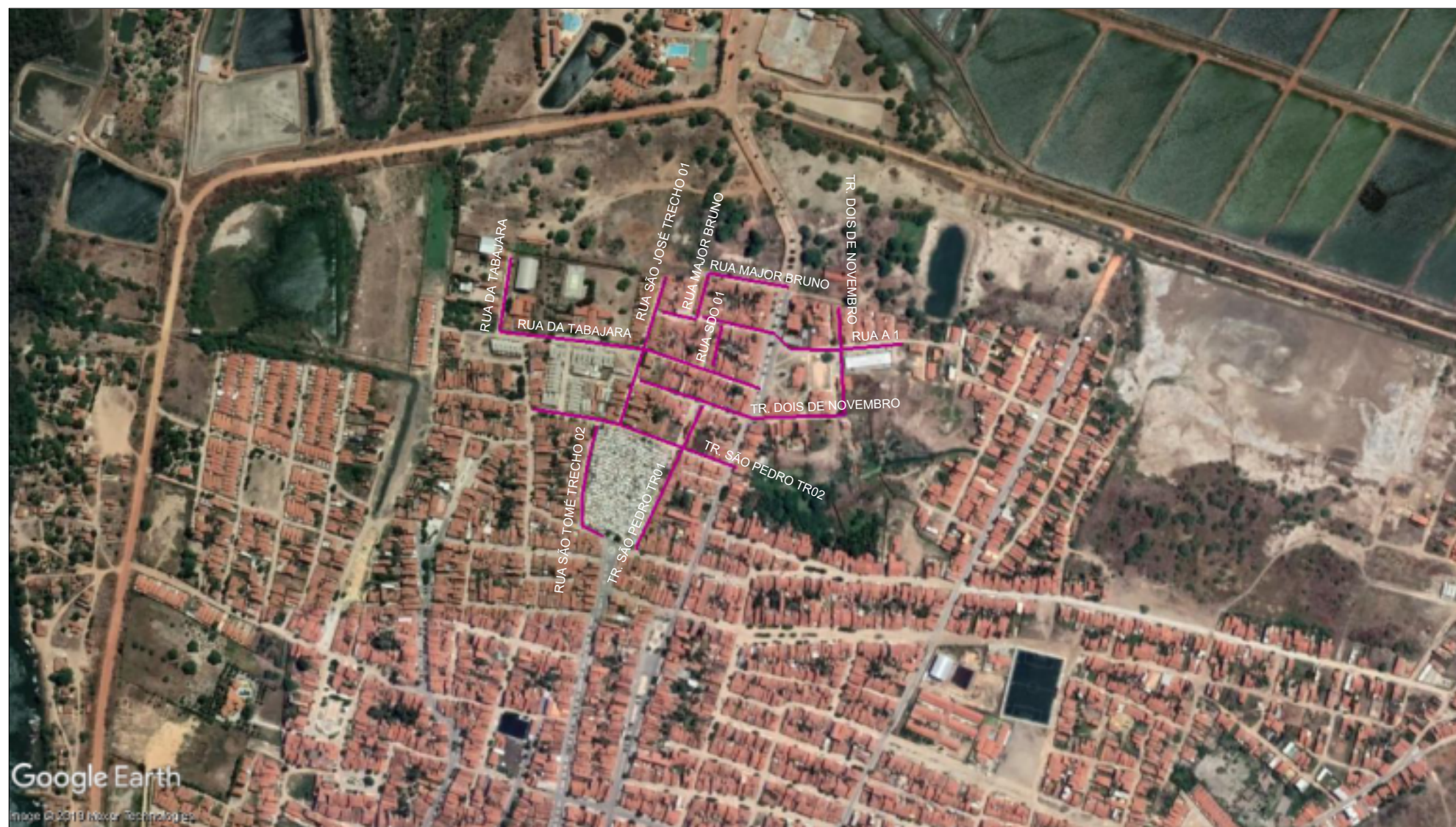
PLANTA DE LOCALIZAÇÃO ESCALA: 1:7500