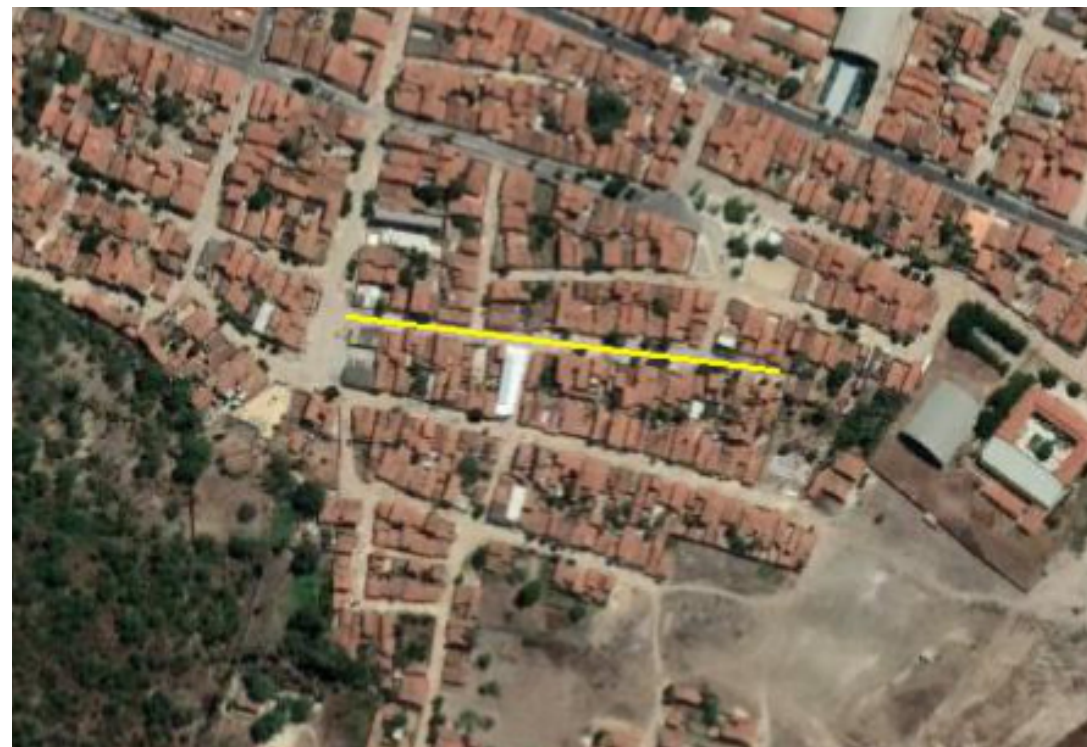
PLANTA DE SITUAÇÃO SEM ESCALA