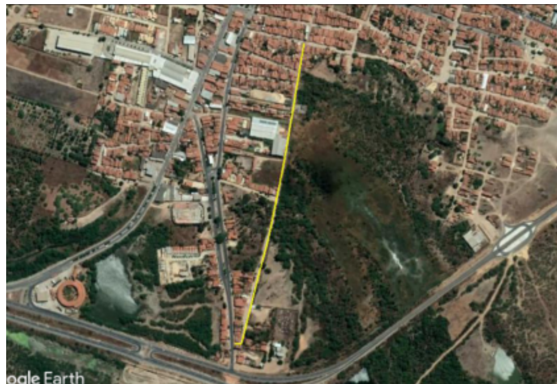
PLANTA DE SITUAÇÃO SEM ESCALA