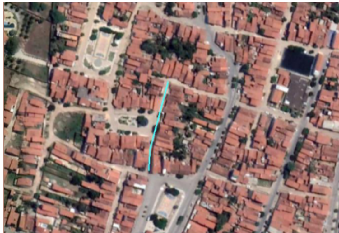
PLANTA DE SITUAÇÃO SEM ESCALA