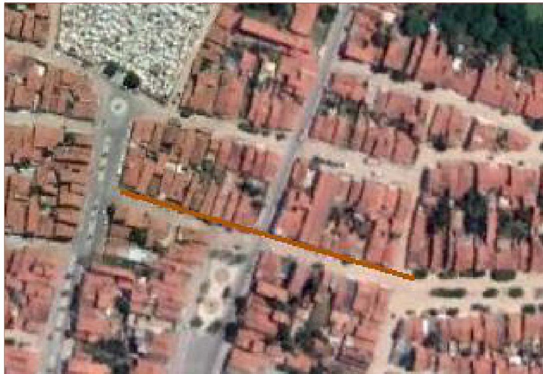
PLANTA DE SITUAÇÃO SEM ESCALA