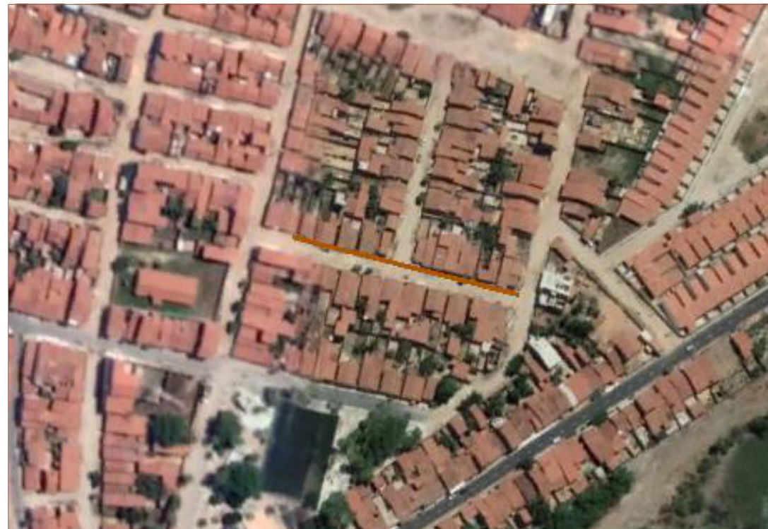
PLANTA DE SITUAÇÃO SEM ESCALA