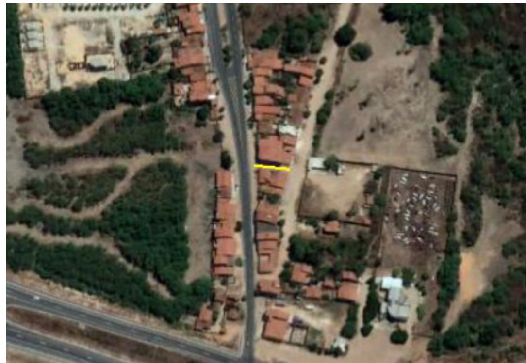
PLANTA DE SITUAÇÃO SEM ESCALA