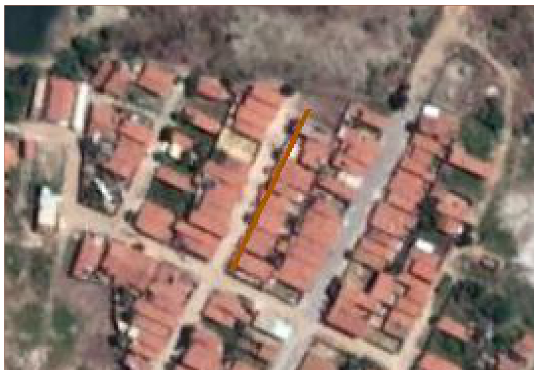
PLANTA DE SITUAÇÃO SEM ESCALA