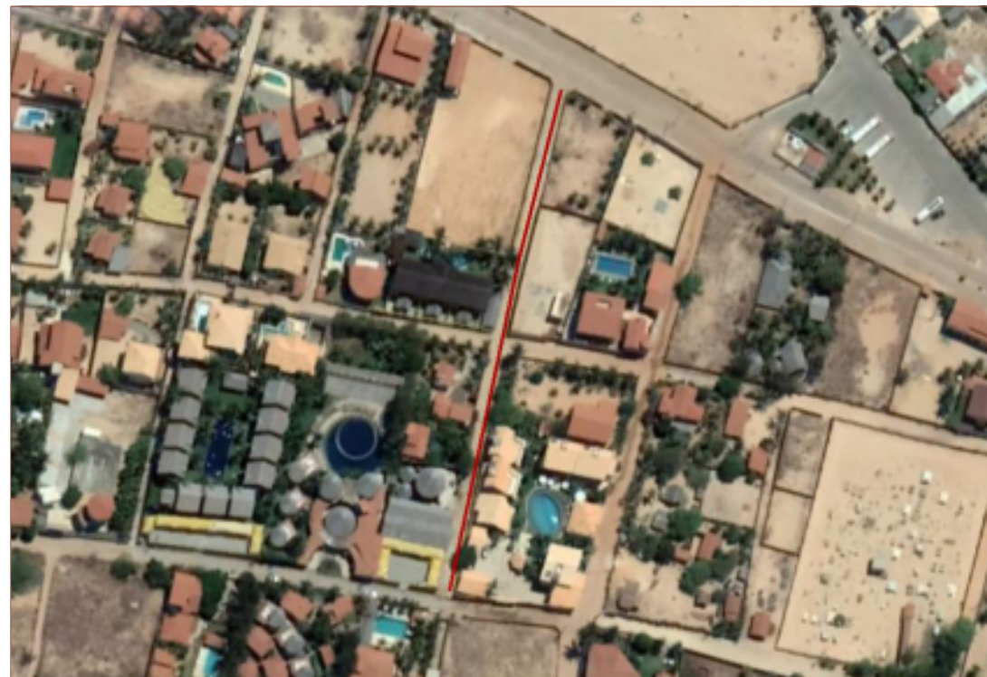
PLANTA DE SITUAÇÃO SEM ESCALA