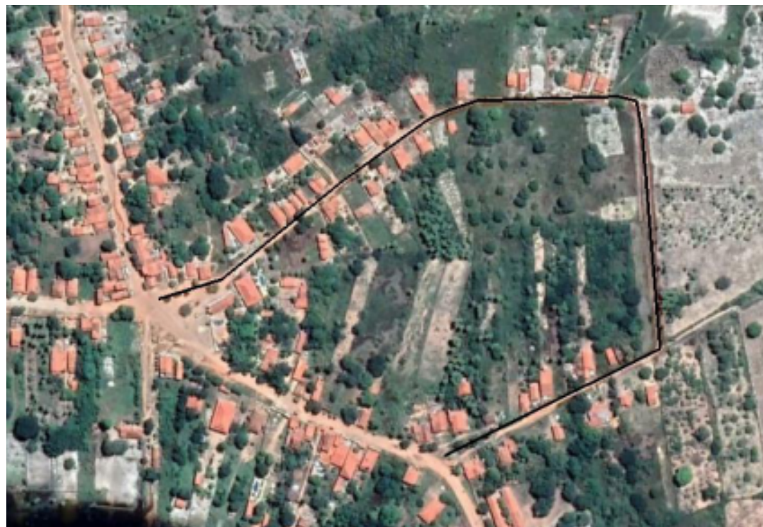
PLANTA DE SITUAÇÃO SEM ESCALA