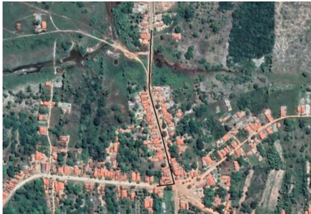
PLANTA DE SITUAÇÃO SEM ESCALA