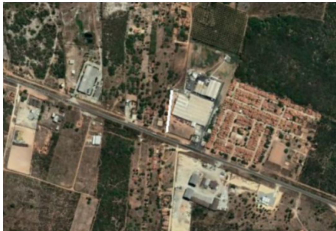
PLANTA DE SITUAÇÃO SEM ESCALA