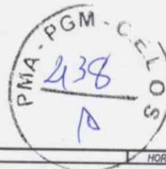
TABELA DE ENCARGOS SOCIAIS TP Nº032/2019-SEINFRA/CELOS - PM DE ARACATI-CE CONSTRUÇÃO DE ARENINHA NA LOCALIDADE DE LAGOA NOVA, ZONA RURAL DO MUNICÍPIO DE ARACATI-CE

Rua Devededil Costa Souza, 565, coco - Fortaleza - CE Fone / Fax: (85) 30677905 / 87016978 E-mail: rmeiraengenharia@hotmail.com