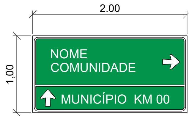
VISTA FRONTAL DA PLACA Sem Escala