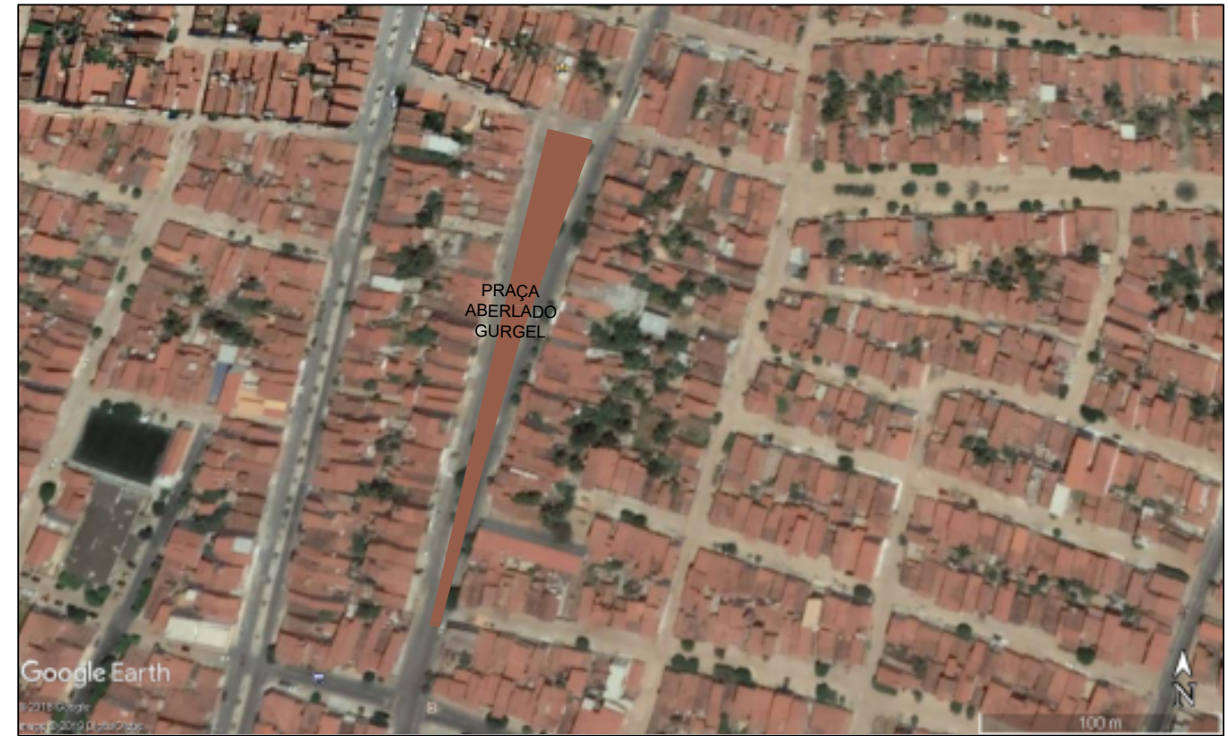
PLANTA DE LOCALIZAÇÃO Escala _____ 1/2800