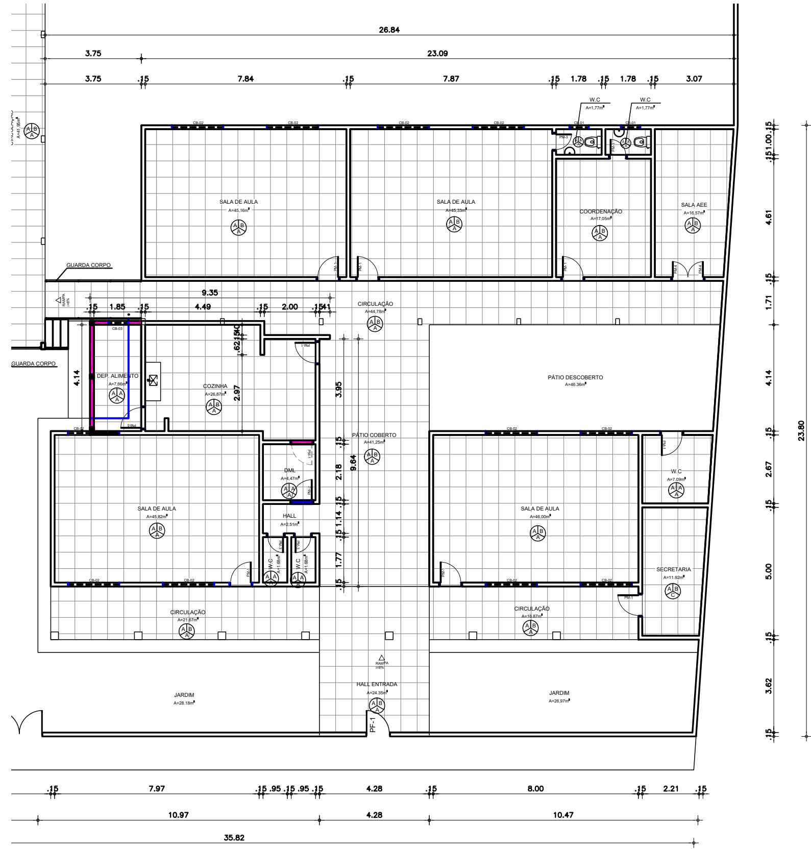
DETALHE 01 esc 1:75