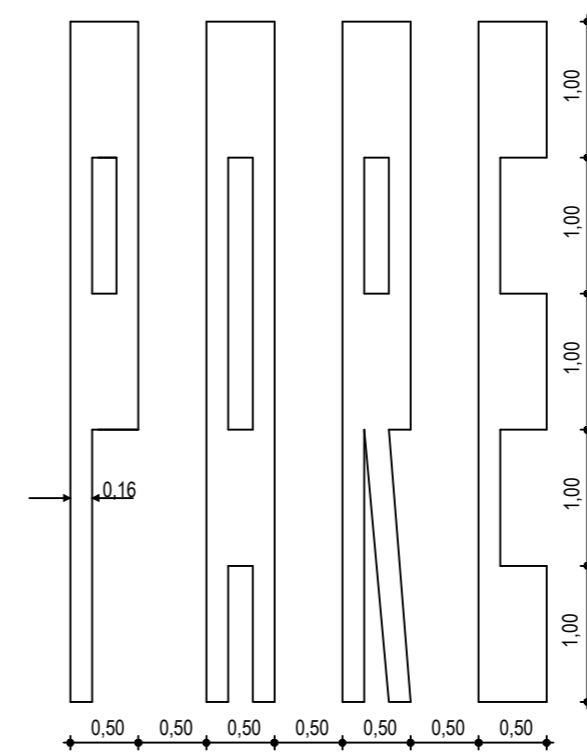
04 DETALHE SÍMBOLO PARE NO PAVIMENTO ESCALA: SEM