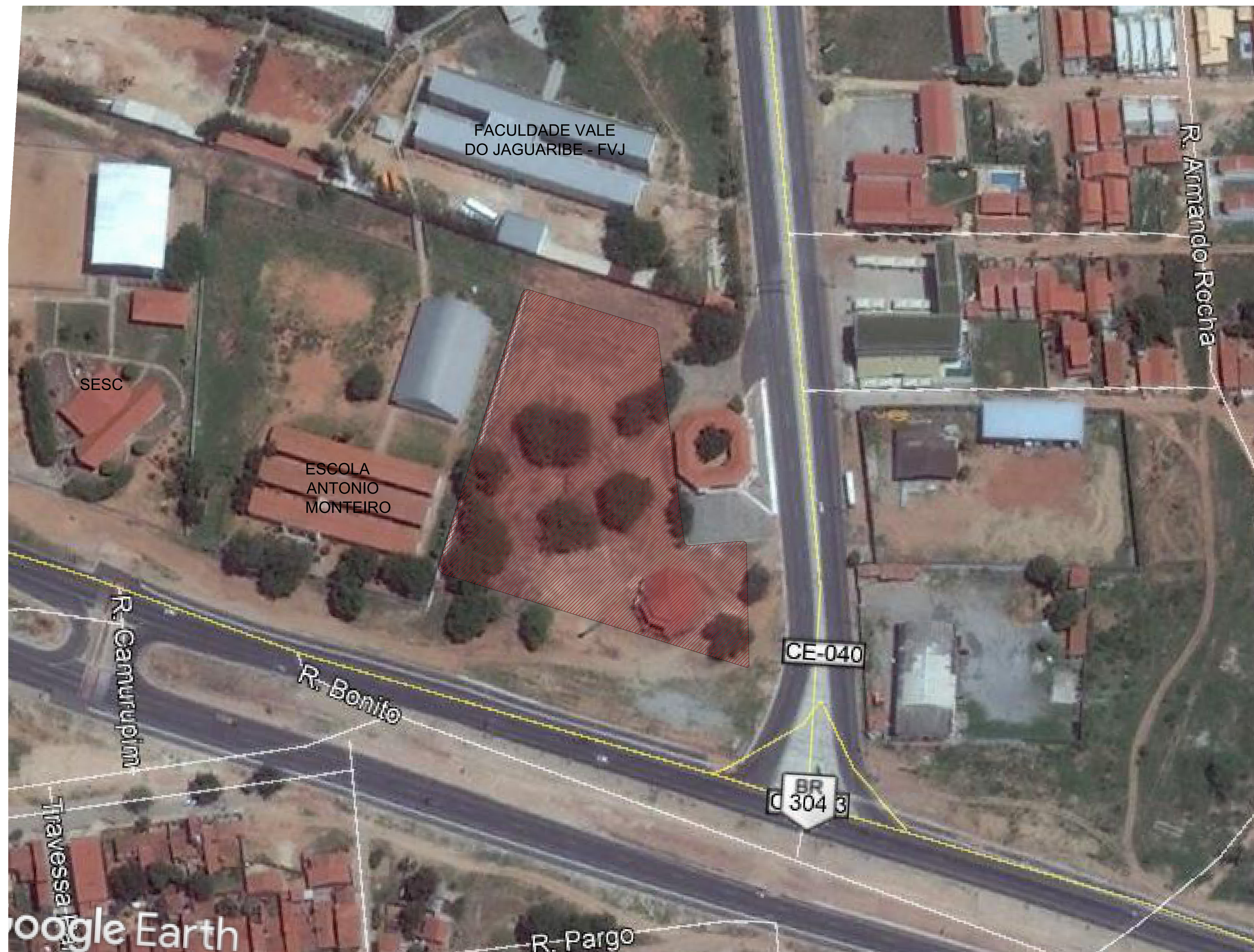
1 PLANTA DE SITUAÇÃO/LOCAÇÃO ESCALA 1:750