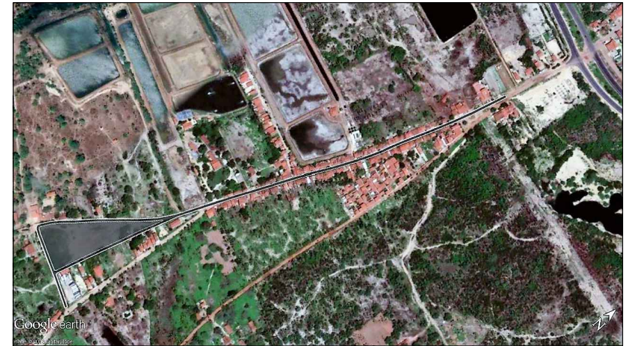
01 IMAGEM DE SATÉLITE SEM ESCALA