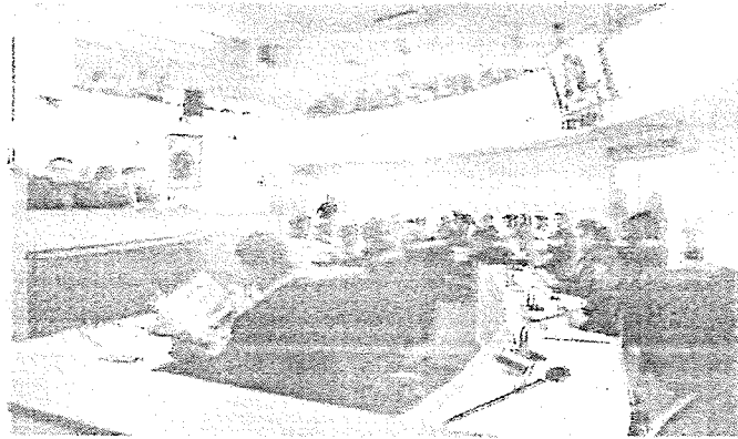
PROJETO da previdência foi aprovado com 15 votos favoráveis

Ele reforçou que o reajuste na alíquota deveria ter sido feito desde 2019, quando foi aprovada a Emenda Constitucional nº 103, autorizando os regimes próprios de previdência dos municípios e estados a ampliar o percentual de contribuição para manter a sustentabilidade financeira dos fundos. "Isso é importante porque vai facilitar a diminuição do déficit total real do Instituto de Previdência de Juazeiro do Norte, que é