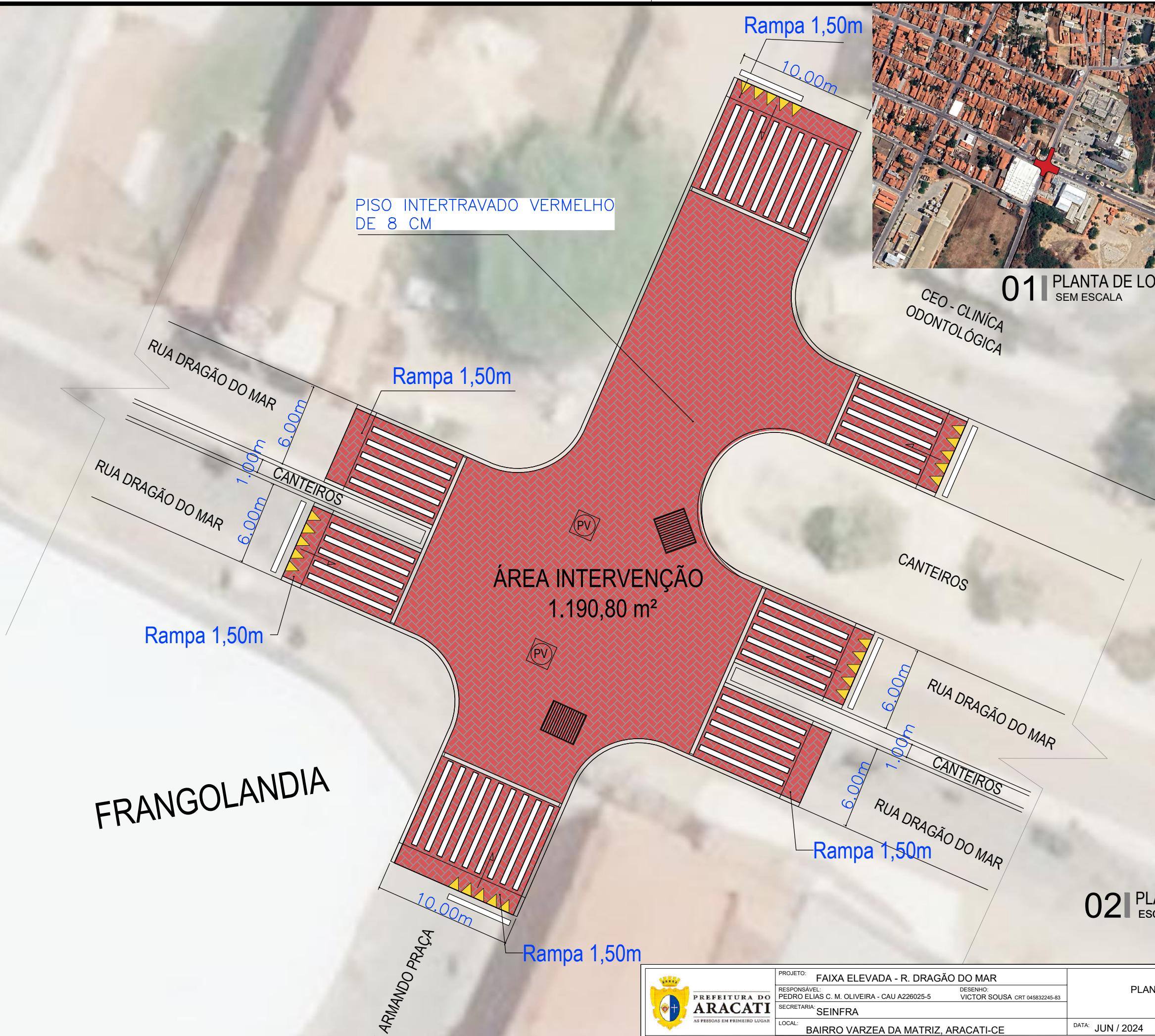
02 PLANTA BAIXA ESCALA 1/100