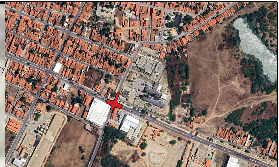
01 PLANTA DE LOCALIZAÇÃO SEM ESCALA