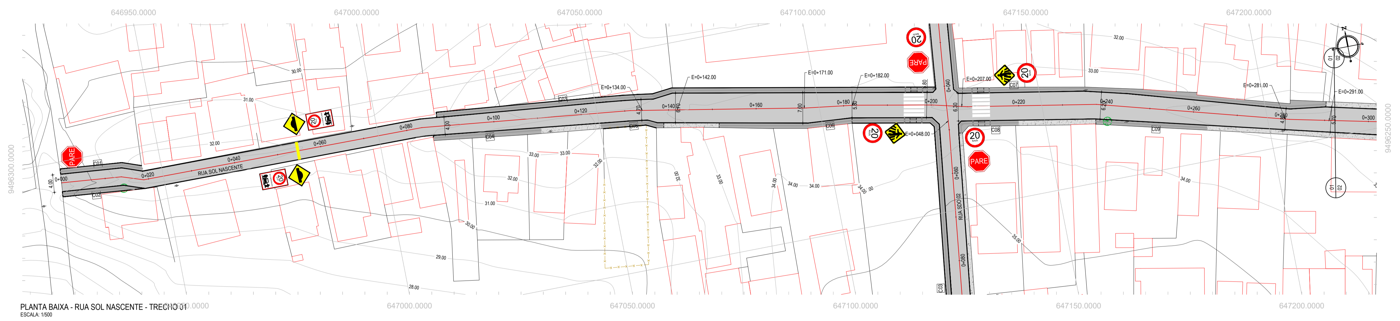
PLANTA BAIXA - RUA SOL NASCENTE - TRECHO 01 ESCALA: 1:500