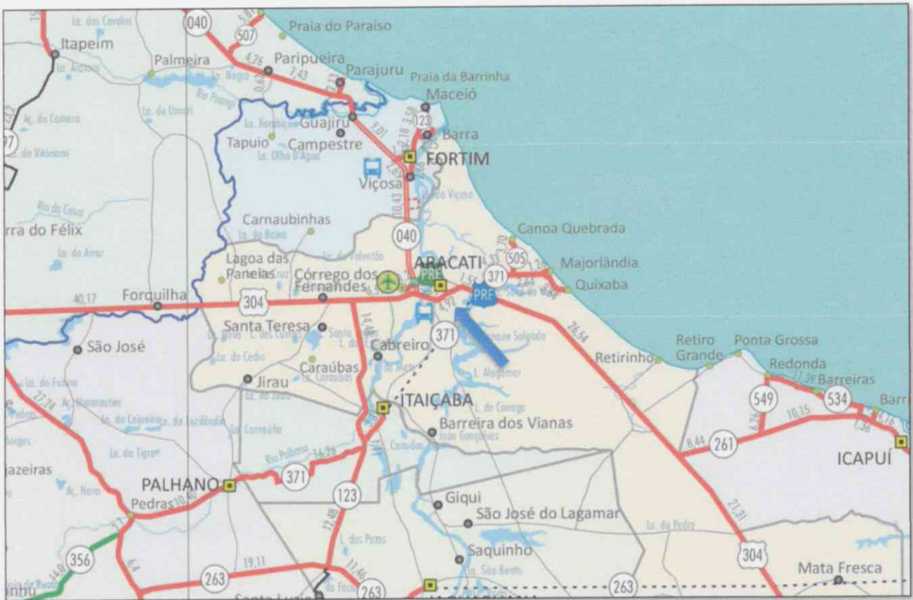
Acessos ao Município