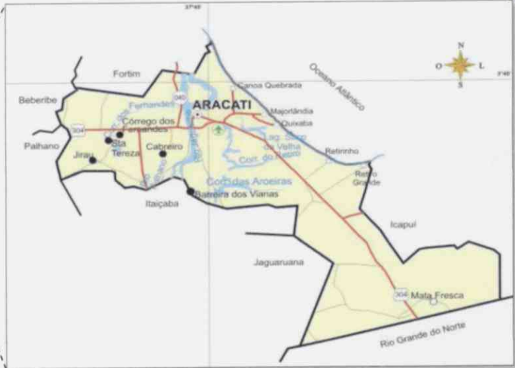
Situação do Município