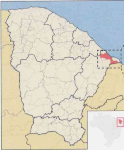
Localização do Município