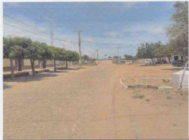
Estrada Principal de Acesso à Escola de 6 Salas