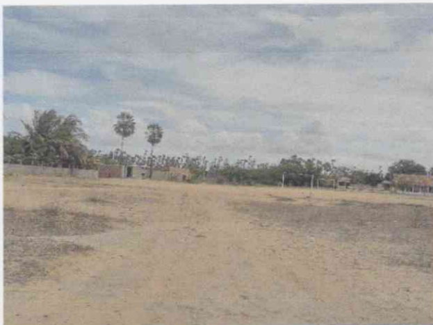
Local da Construção da Escola de 6 Salas

Conforme exposto a seguir apresentamos fotos do local da construção da escola necessárias para o bom entendimento do projeto: