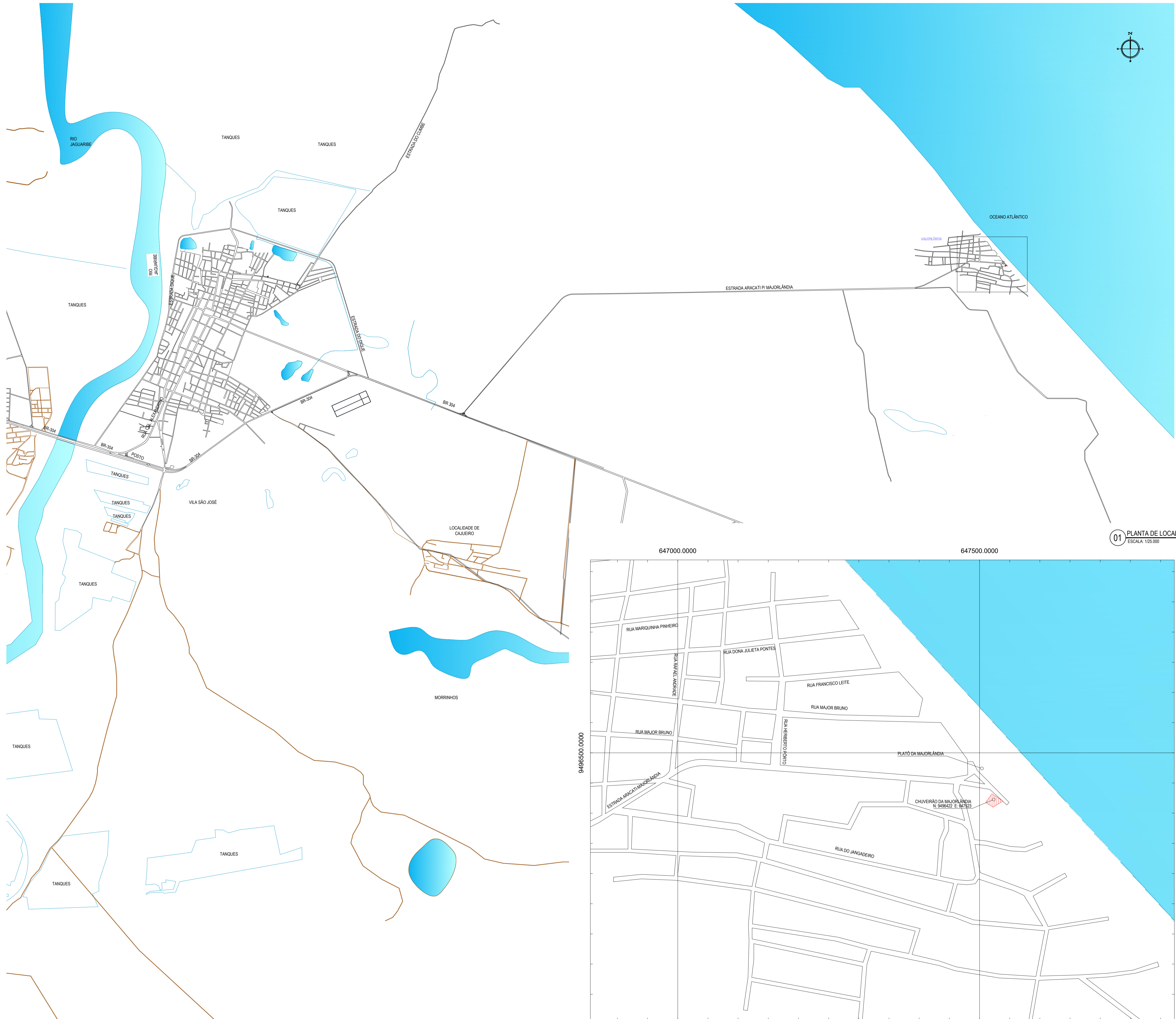
01 PLANTA DE LOCALIZAÇÃO ESCALA: 1:25.000