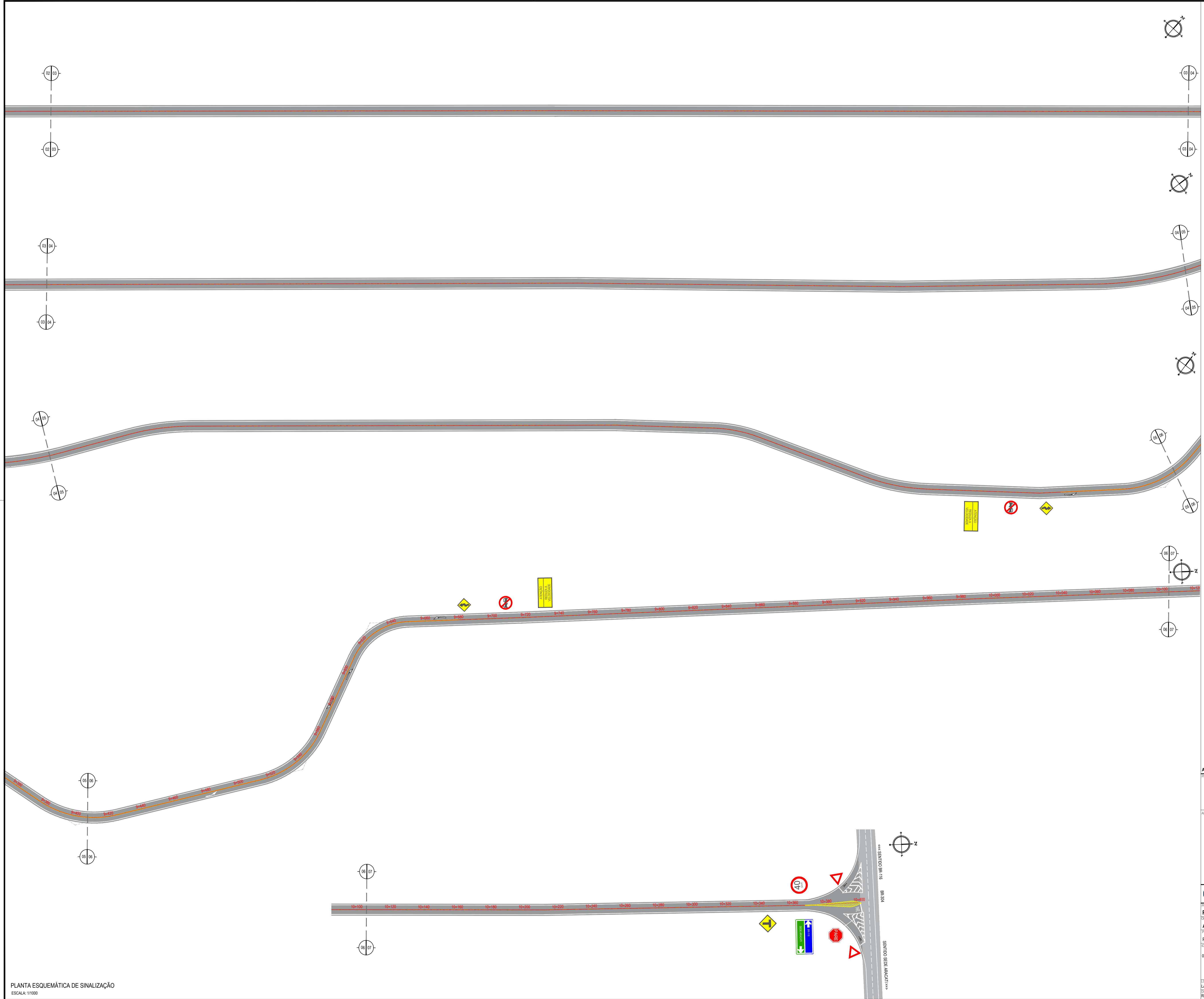
PLANTA ESQUEMÁTICA DE SINALIZAÇÃO ESCALA: 1/1000