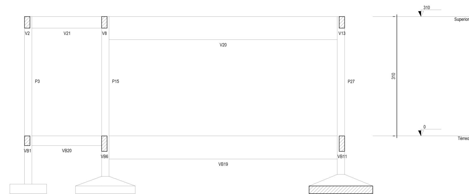
CORTE B-B Esc. 1:50