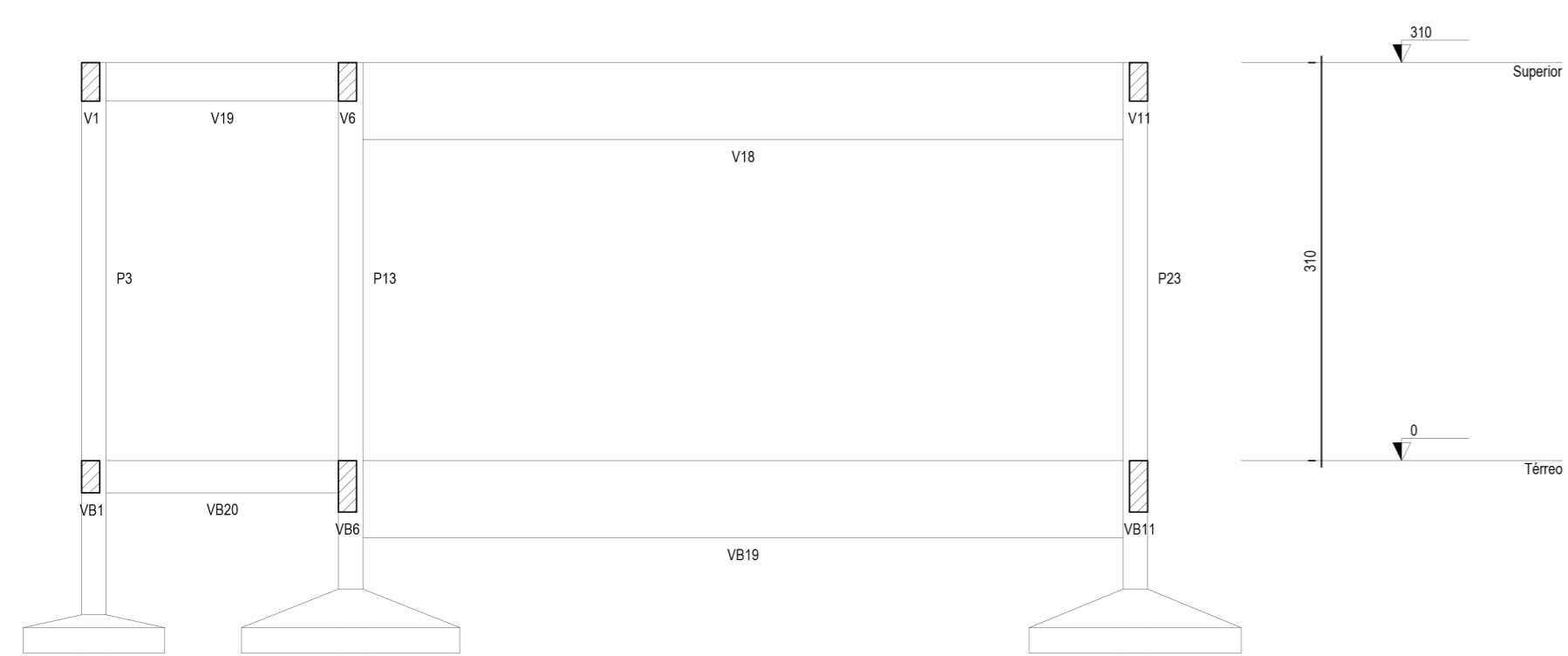
CORTE B-B Esc: 1/50