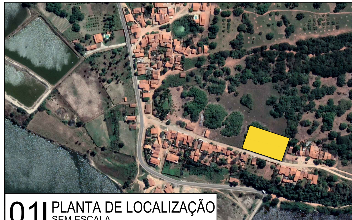
01 PLANTA DE LOCALIZAÇÃO SEM ESCALA

VÉRTICE: V 01 Lat: 4°40'10,9790" S Long: 37°49'02,7585" W K: 0,99981296 CM: -0°05'46,6393" Declinação Magnética de: -21°18'25" na data: 21/09/23 com variação anual de: 0°01'27"