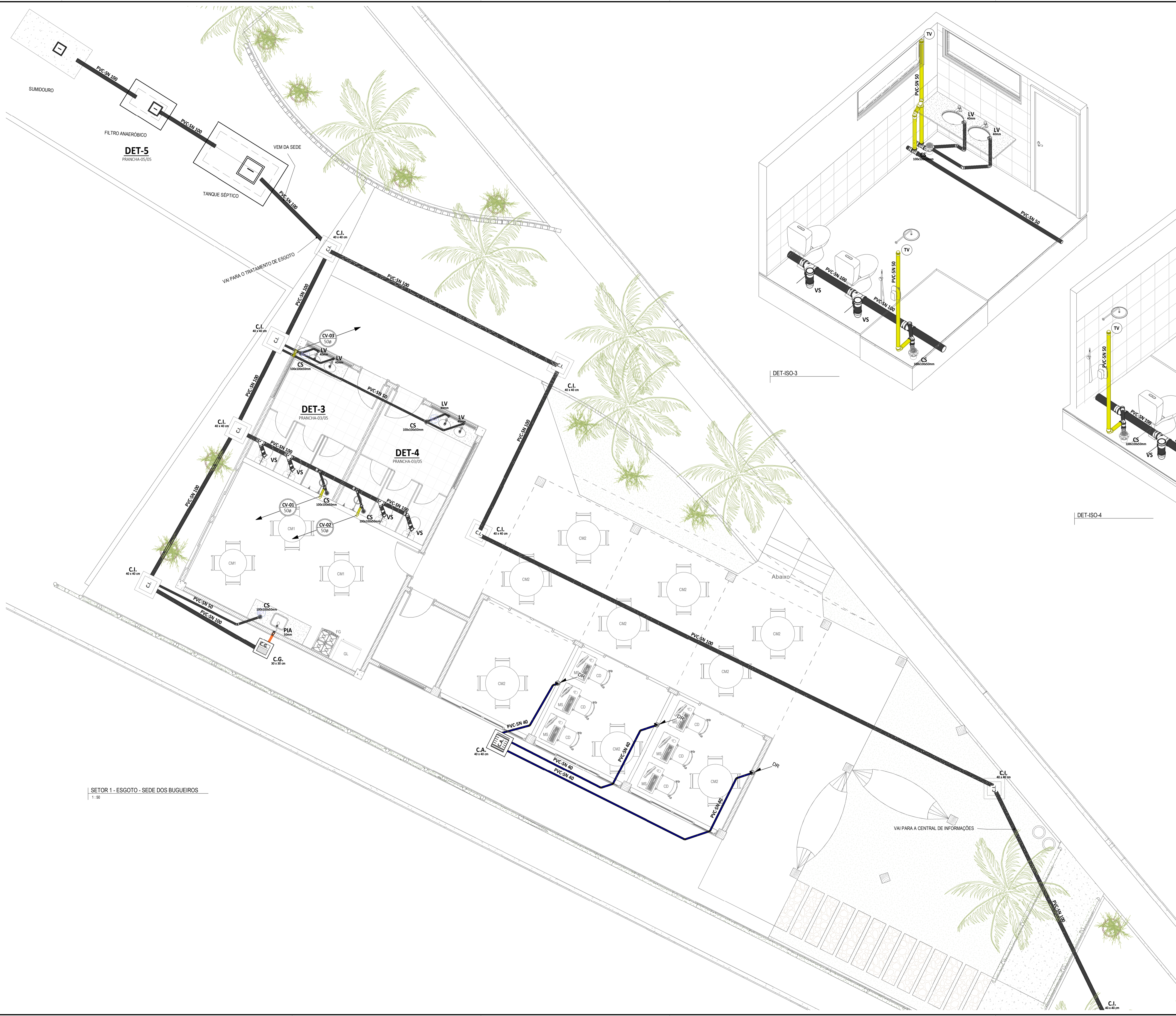
SETOR 1 - ESGOTO - SEDE DOS BUGUEIROS 1:50