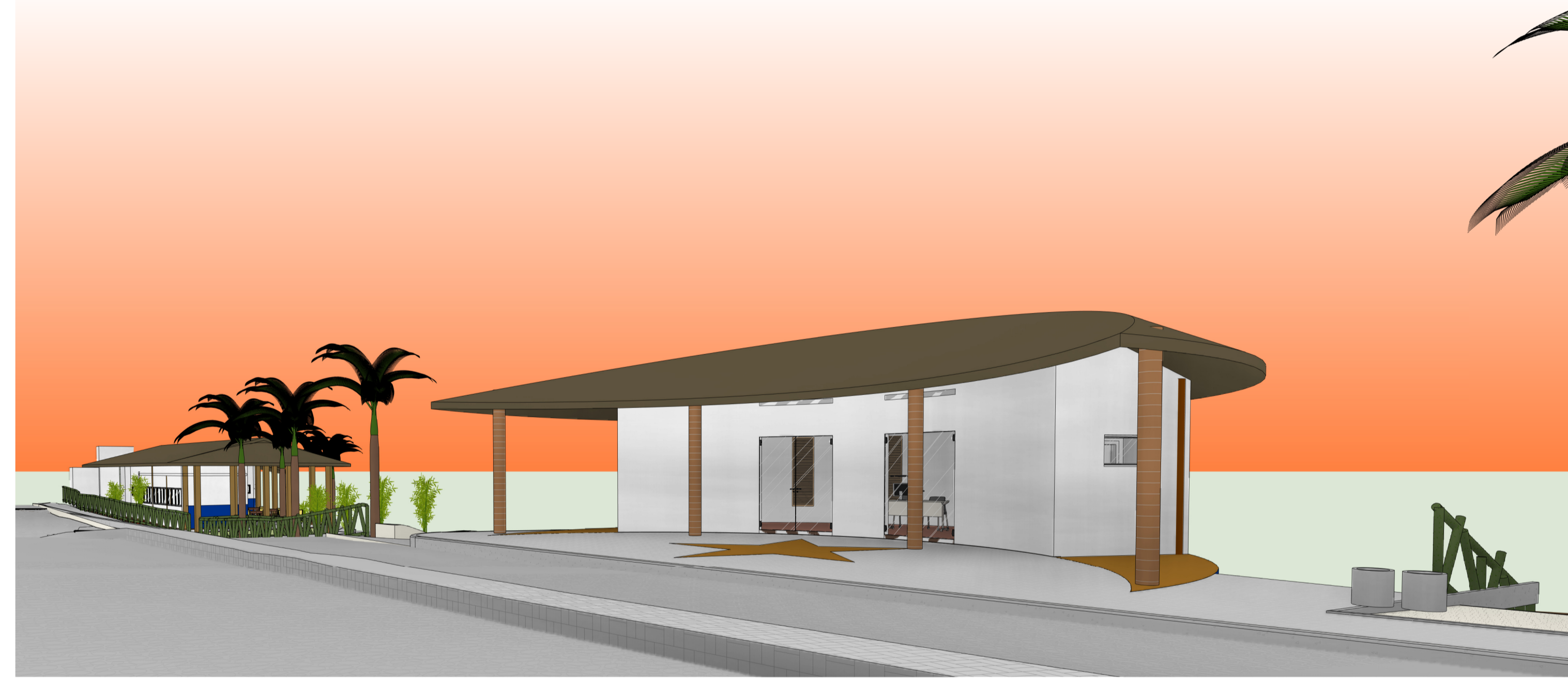
2 CENTRAL DE TURISMO