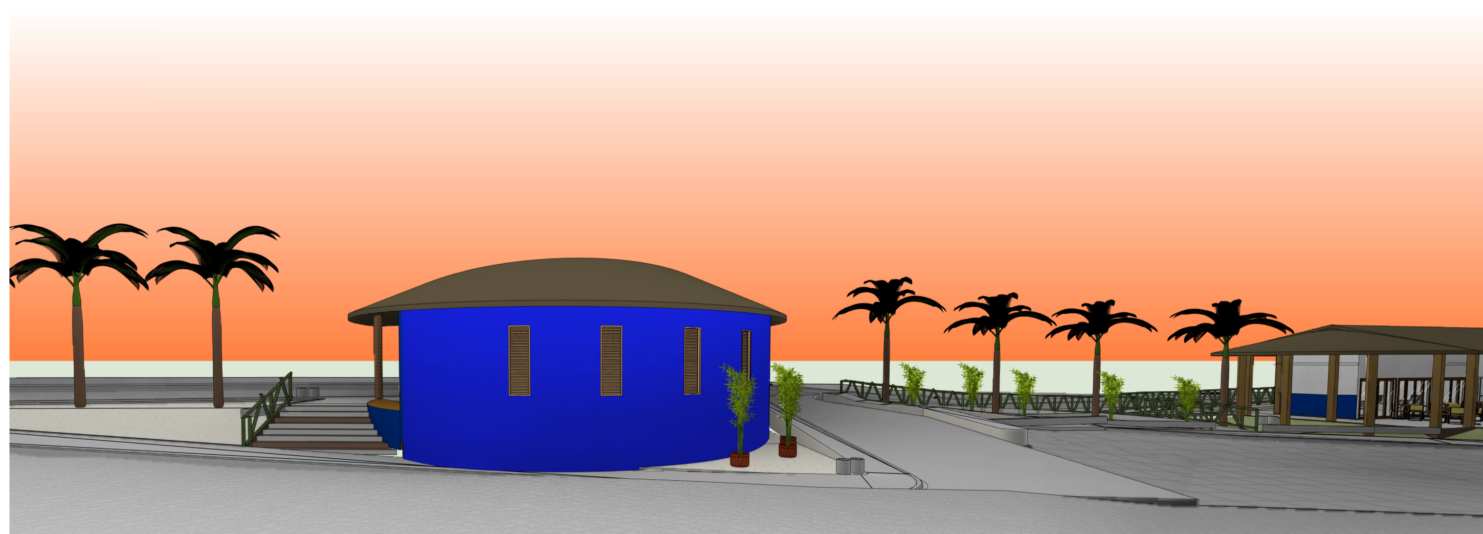
3 CENTRAL DE TURISMO FACHADA SUL